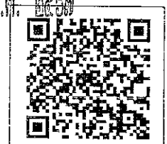
QR-Code เพื่อสอบถามข้อมูล