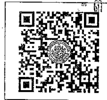
QR-Code เว็บไซต์