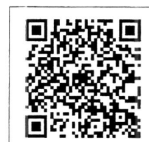
QR-Code เพื่อสอบถาม