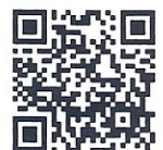
QR-Code เพื่อจองห้องพัก

โทรศัพท์: ๐๒-๔๒๒-๙๒๒๒ E-mail : rsvn@royalriverhotel.com