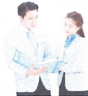
บริการเคลมออนไลน์ สะดวกรวดเร็วในการบริการ