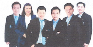
พนักงานที่มีประสบการณ์ ด้านการประกันภัย