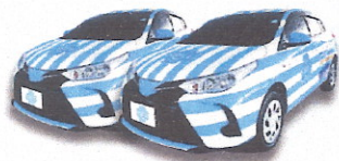
มีรถมาหลายที่ให้บริการ ทุกทิศทั่วไทย กว่า 600 คัน