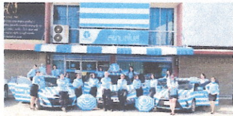
สาขาพร้อมให้บริการ ถึง 69 สาขา ทั่วประเทศ