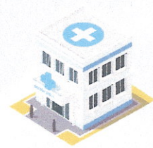
มีโรงพยาบาลคู่สัญญา มากกว่า 400 แห่ง