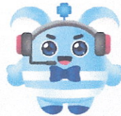
Call Center 1434 พร้อมให้บริการ 24 ชม.