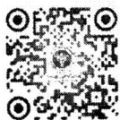
แบบใบสมัครขอย้ายหรือขอโอน

จึงเรียนมาเพื่อโปรดทราบ และโปรดแจ้งให้ข้าราชการในสังกัดทราบโดยทั่วกันด้วย จะเป็นพระคุณ